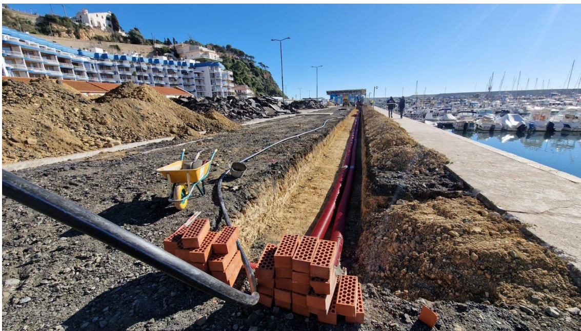
Urbanització de la zona de ribera.

Les obres han començat amb el desmuntatge d'elements de la coberta que no tenien funcionalitat, de cara a aprofitar la coberta interior per a la instal·lació de plaques fotovoltaïques. Després, la coberta s'impermeabilitzarà per eliminar filtracions d'aigua perquè tant l'estructura metàl·lica i les bigues de fusta com els béns que alberga aquesta nau no pateixin afectacions quan plou. A més, l'estructura metàl·lica rebrà un tractament per eliminar la seva corrosió a causa de la seva exposició a l'ambient marí. Així mateix, les parts de les bigues afectades per la humitat també se substituiran.