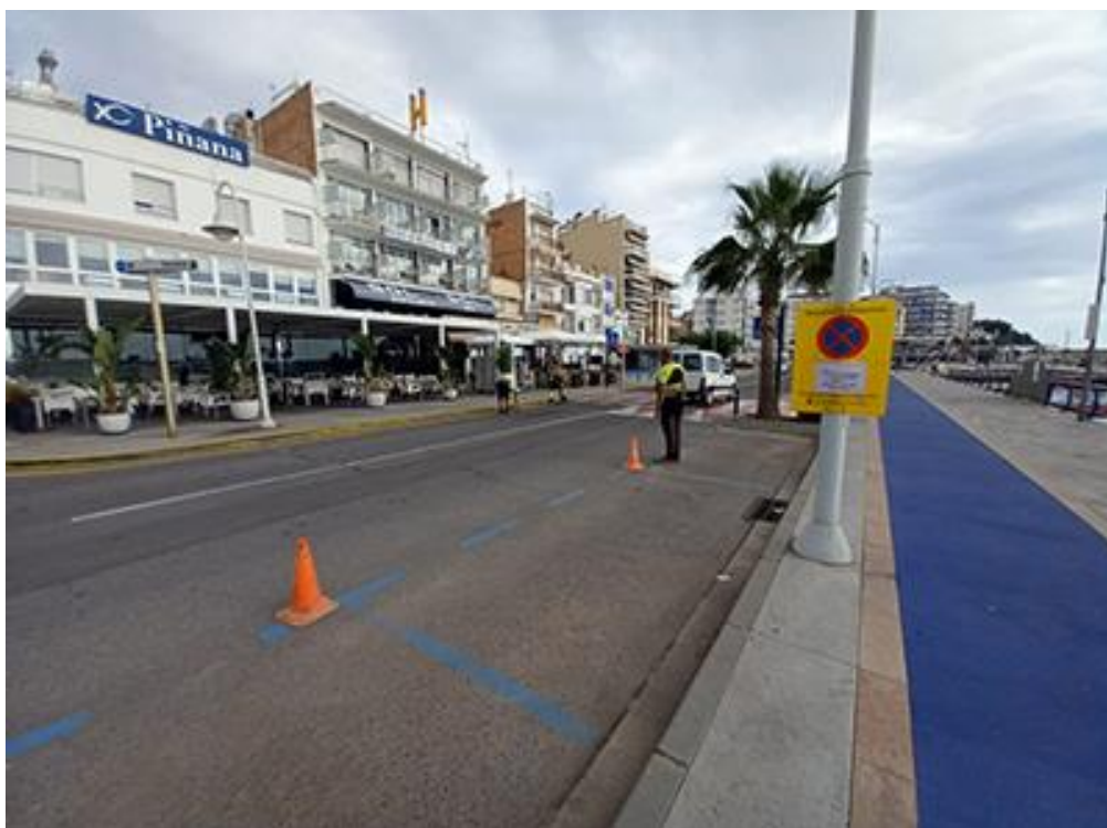
Senyalització de les afectacions al trànsit a la façana marítima de l'Ampolla.