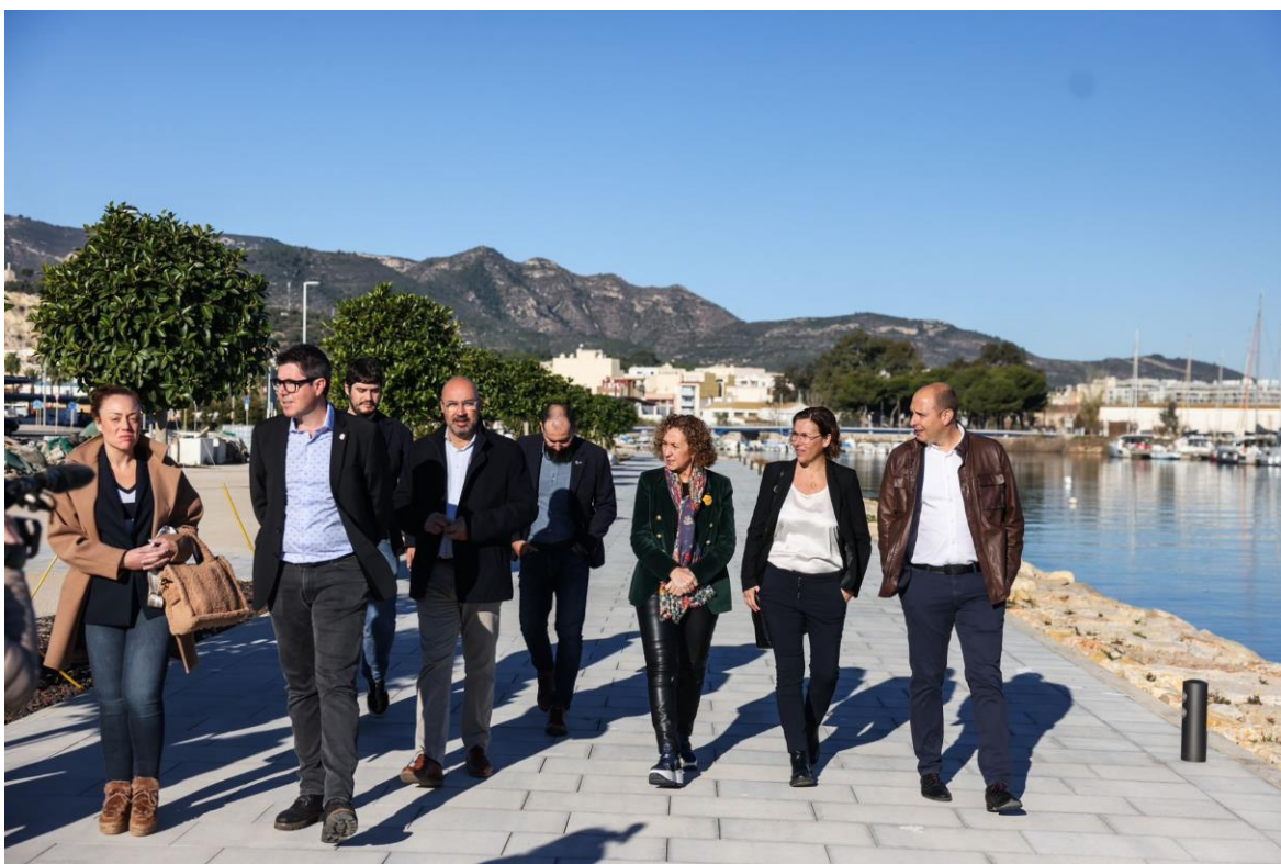
Capella al Port de la Ràpita, aquest matí.

La consellera de Territori, Ester Capella i Farré, ha visitat avui el port de la Ràpita on el Departament, a través de Ports de la Generalitat, ha invertit 2,3 milions d'euros en diverses obres de millora. La consellera ha visitat l'edifici que albergarà la base nàutica, on també se n'ha urbanitzat l'entorn; les marquesines on ja s'han instal·lat i estan ja a ple rendiment les plaques solars fotovoltaïques que