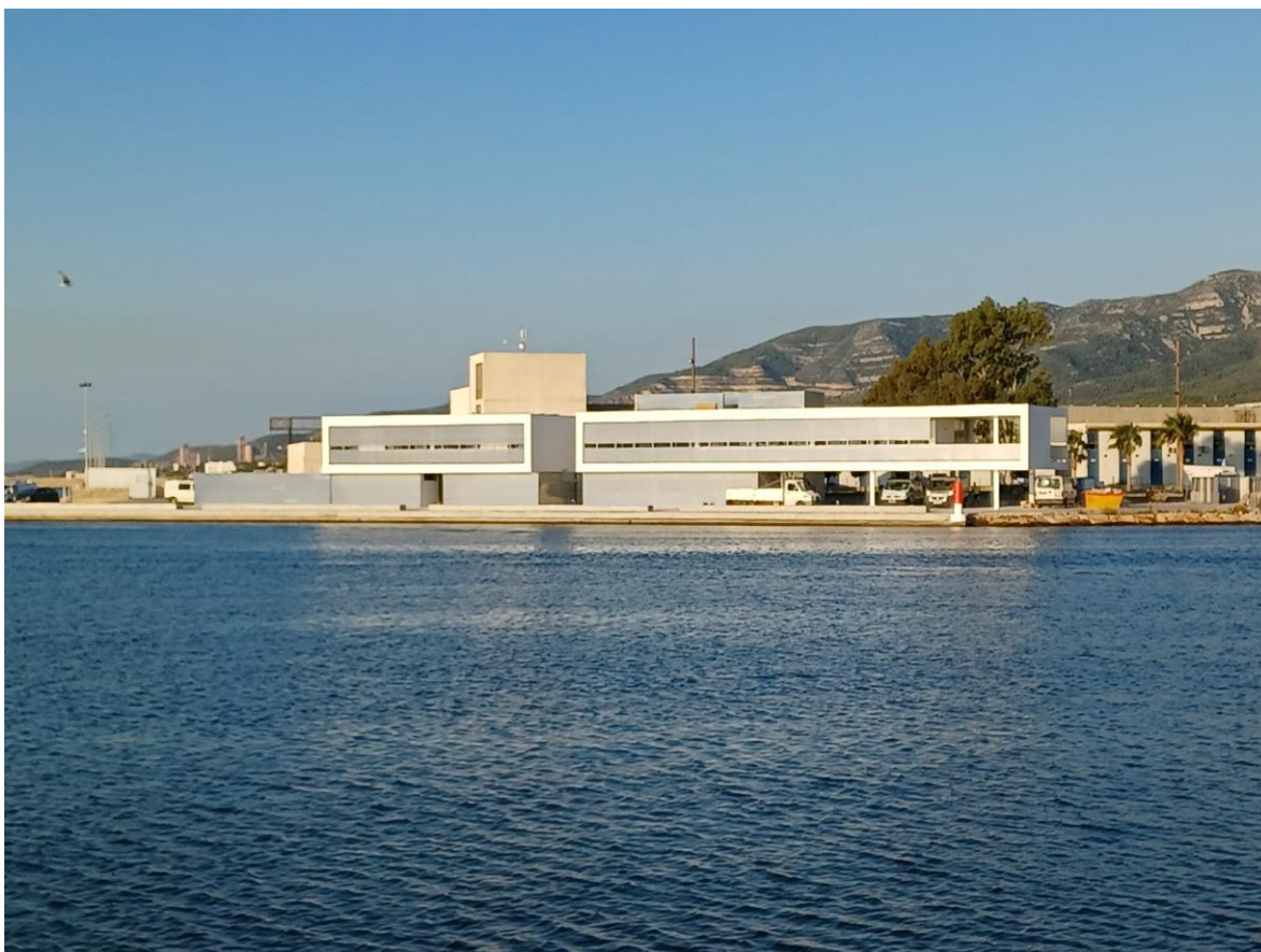
L'edifici que albergarà la base nàutica.

L'edifici construït està format per una planta baixa i una planta pis. La planta baixa té dues zones: un espai cobert per ubicar les oficines, els vestidors, els serveis i un porxo. A més, disposa d'un espai descobert per emmagatzemar els caiacs, les taules de surf, les armilles nàutiques i les embarcacions de vela lleugera, entre altres. A la planta pis hi ha espai per encabir una sala d'actes, aules i zones de servei. La coberta de l'edifici compta amb 108 plaques solars per tal que la base nàutica sigui un edifici autosuficient energèticament.