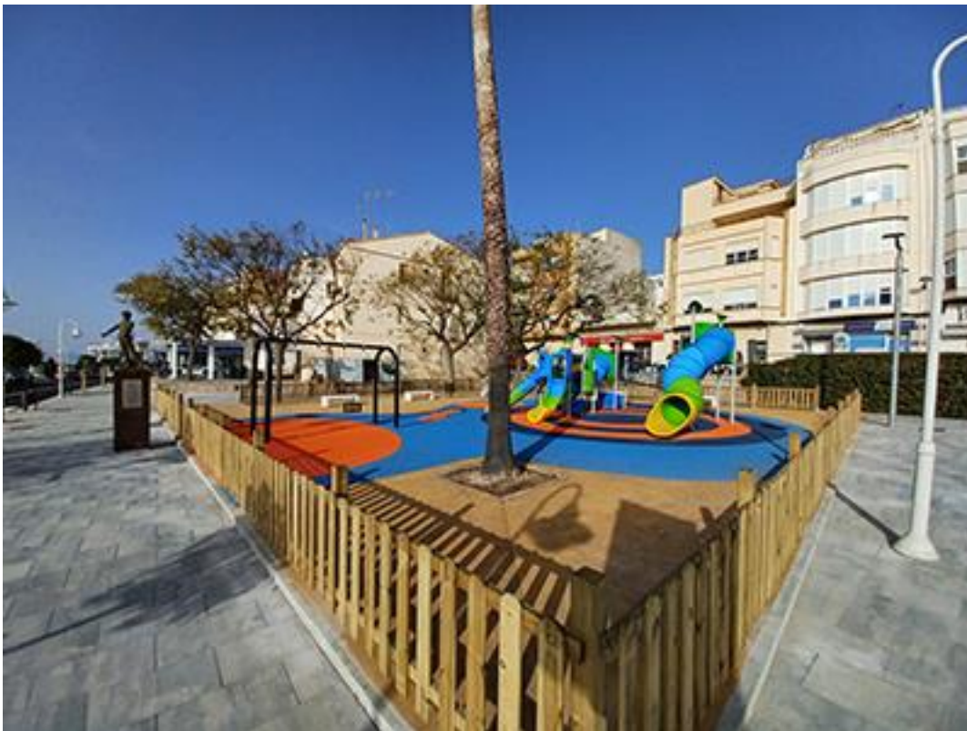
Parc infantil renovat al passeig marítim de l'Ampolla.

L'execució dels treballs s'ha fet per trams i fases amb l'objectiu de causar les menors molèsties possibles a usuaris dels locals i als veïns i veïnes de la zona. Mentre han durat les obres i de manera provisional, el trànsit ha estat de sentit únic, en coordinació amb l'ajuntament de l'Ampolla. Es va crear una vorera d'accés al costat de mar i es van instal·lar cinc passarel·les per tal que els vianants poguessin accedir millor a la zona. Així mateix, es va prohibir la circulació de camions pel carrer Platja. Un cop acabes les obres, s'ha restablert la circulació de camions i el trànsit del passeig marítim ha tornat a ser de doble sentit.